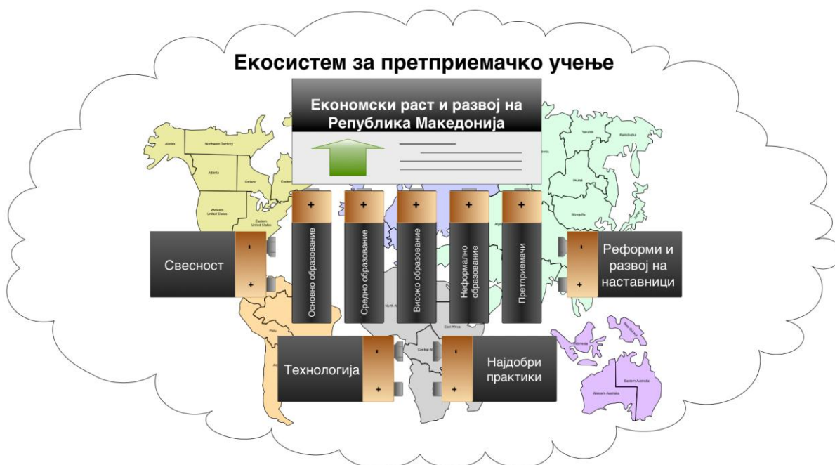
Слика 2: Екосистем на претприемачко учење

Подрачјата со најголем приоритет за Стратегијата за претприемачко учење во Република Македонија се дадени во пет главни столбови кои се образложени подолу, додека технологијата и добрите практики се двигателите на стратегијата кои ќе ја зголемат севкупната свест за ПУ и ќе доведат до реформи и континуирано усовршување на наставниците/обучувачите (давателите на услугите). Сите тие се предуслови за постигнување на одржлив економски развој и просперитет на Република Македонија.